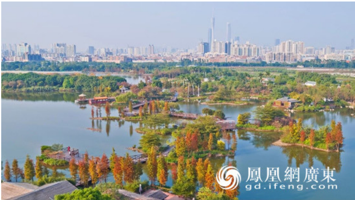
图为海珠湿地航拍图

今天，这块兼具“城市之肺”“城市之肾”功能的湿地公园，可以用美景如画来形容，成为当地民众休闲度假的好去处，每到周末，人们纷纷来到这个“鱼鸟天堂”“天然氧吧”，游人密度之大，已需要用预约的方式来疏导。