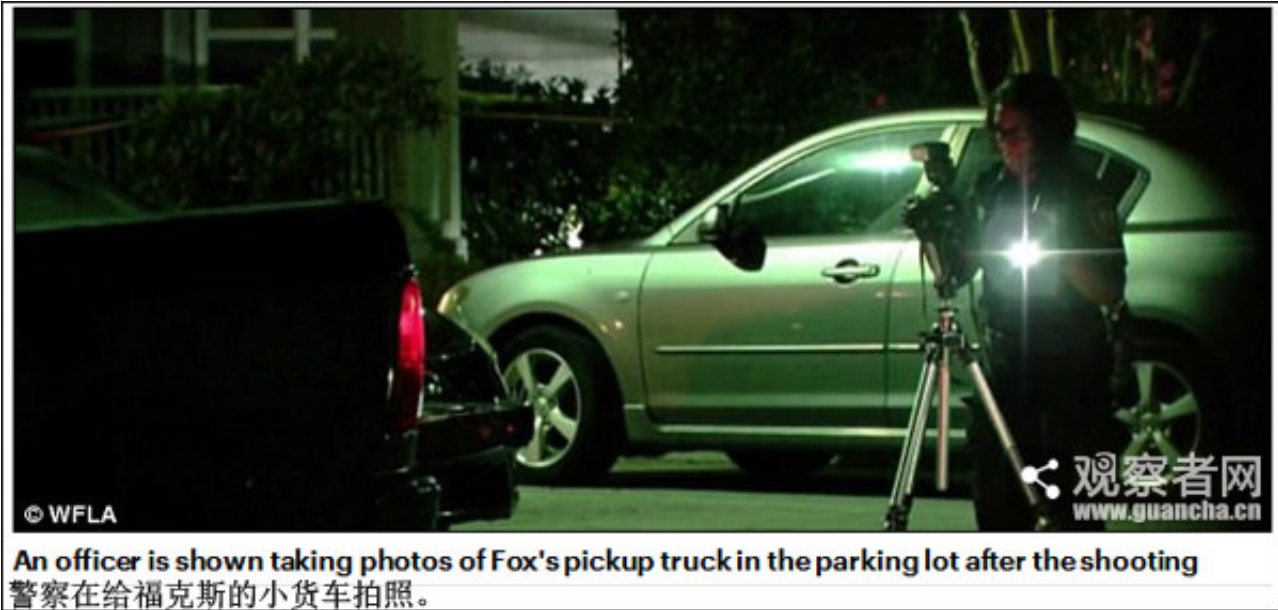
An officer is shown taking photos of Fox's pickup truck in the parking lot after the shooting 警察在给福克斯的小货车拍照。