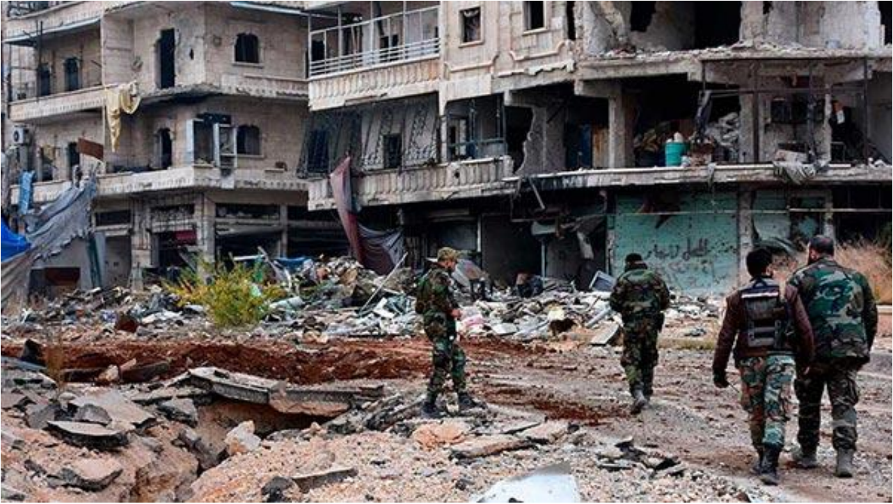
叙利亚政府军进入城区

据新华社14日报道，叙政府军中将扎伊德·阿勒萨利赫是叙政府设立的阿勒颇安全委员会负责人。他在政府军12日收复的谢赫·赛义德区对媒体记者说：“在阿勒颇东部的战事已进入最后阶段，他们（反对派武装）没有多少时间了。他们要么投降要么受死。”