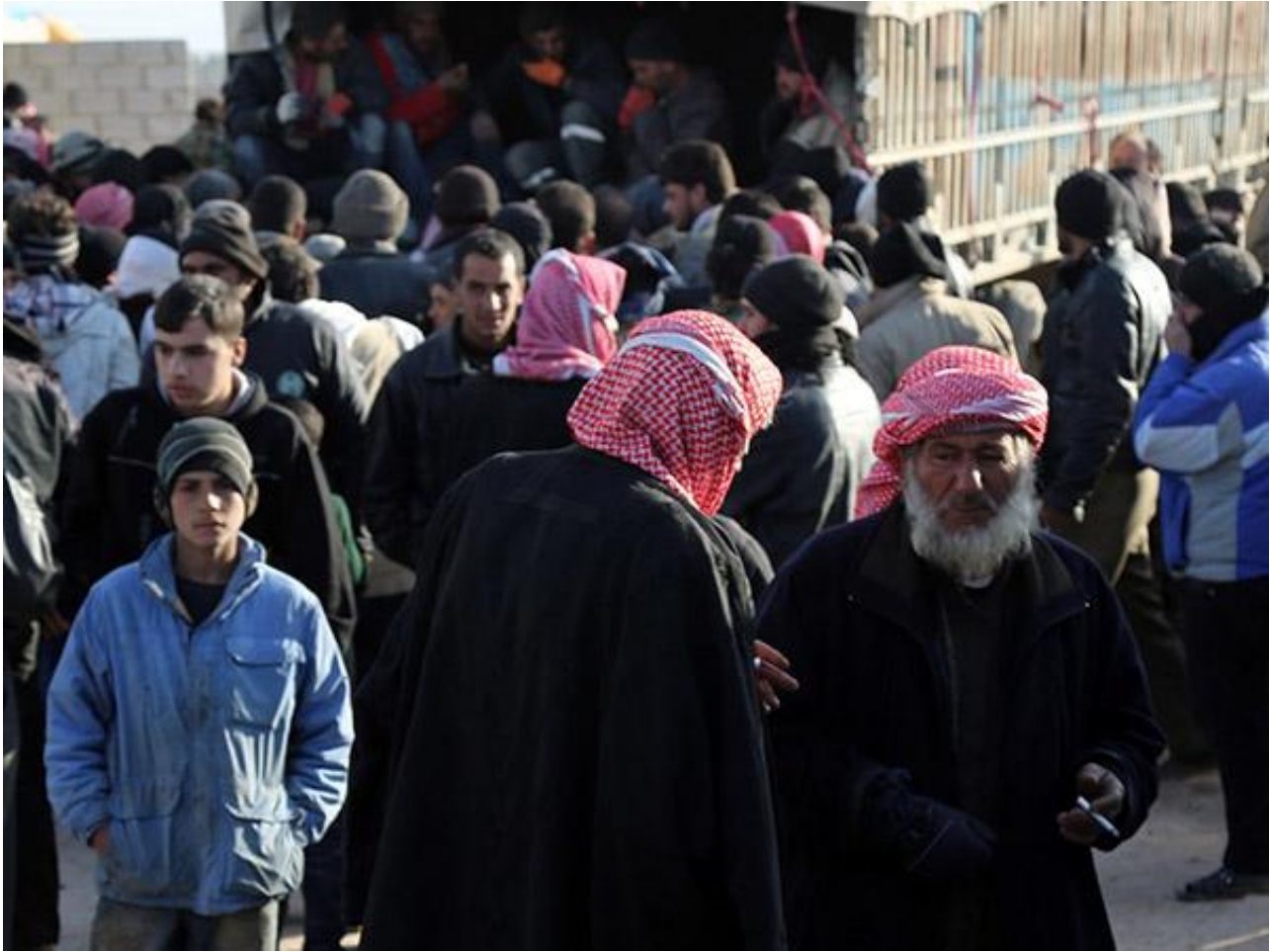
部分阿勒颇难民将前往土耳其安置