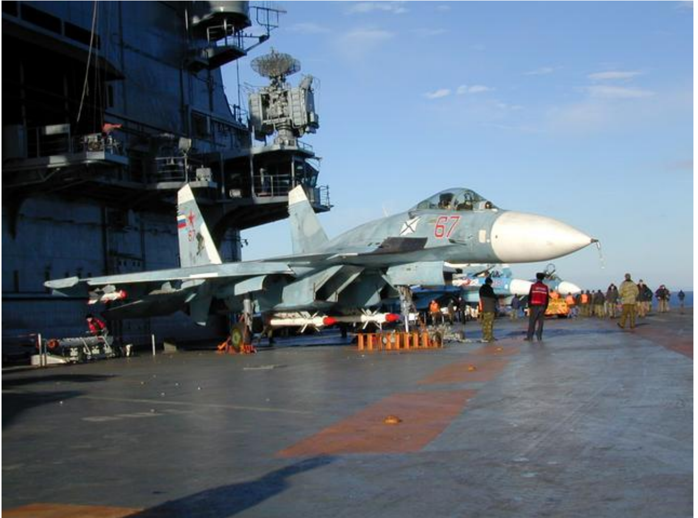
资料图：停放在航母甲板的苏33战机

中新网12月8日电 据俄罗斯卫星网8日报道，消息人士称，俄国防部“库兹涅佐夫海军上将”号航母舰载苏-33战斗机在地中海失事事件调查委员会推测，这起事故可能是因驾驶失误所致。