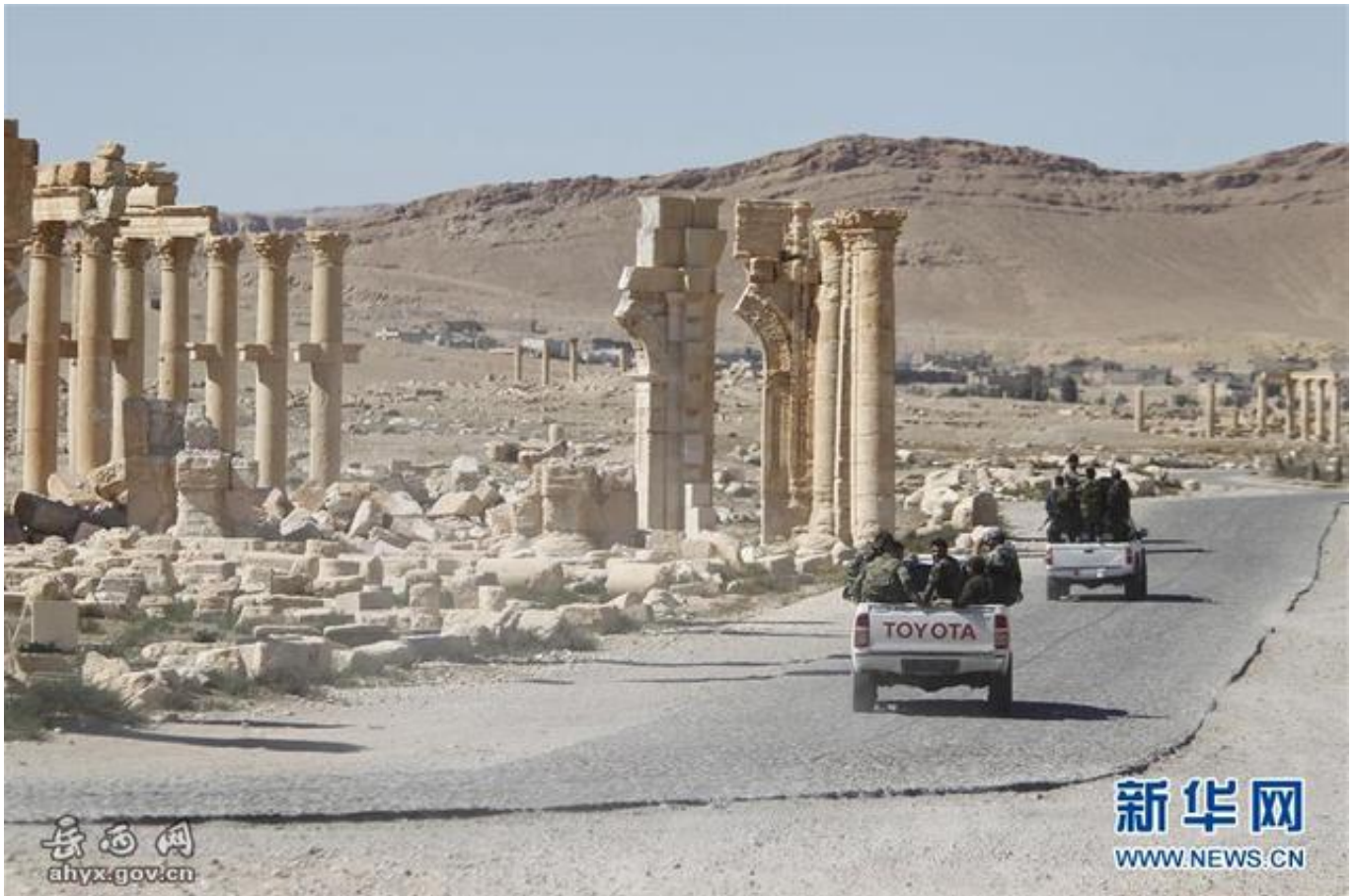
资料图：此前叙利亚政府军在巴尔米拉巡逻

此外，尽管叙利亚政府军集中兵力收复阿勒颇，战事却仍显焦灼；与此同时，有迹象表明极端武装开始转战政府军势力薄弱地区。