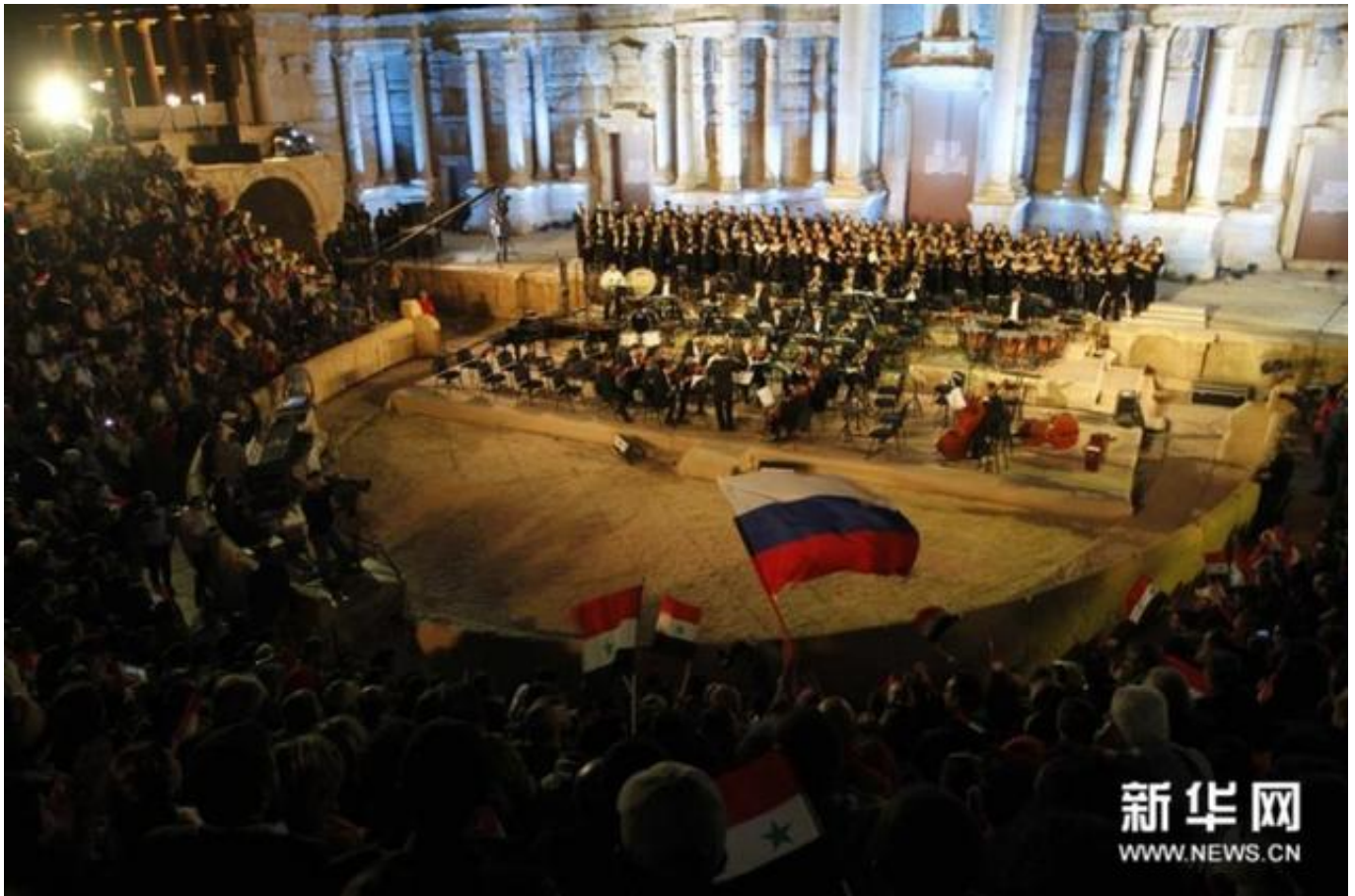
5月，叙利亚与俄罗斯在巴尔米拉举行大型音乐会

据央视新闻，有叙利亚分析人士称，“伊斯兰国”再次攻打巴尔米拉可能是为了扩大周旋范围。