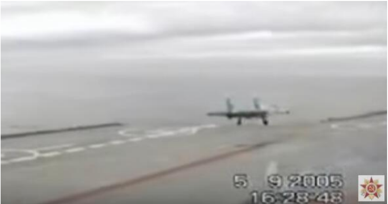
（资料图）2005年时一架苏-33舰载机因阻拦索断裂坠海

俄罗斯“库兹涅佐夫”号航母这次出击叙利亚从一开始就被负面消息纠缠，西方国家嘲讽冒着黑烟的俄罗斯航母是“重演第二太平洋舰队悲剧”（日俄战争期间俄将波罗的海舰队调往远东作战，结果遭到惨败）。继上月一架米格-29KUBR战斗机因航母阻拦索故障难以修复，耗尽燃油坠毁之后，12月3日，又一架俄罗斯苏-33舰载战斗机坠毁。事故原因据称是着舰时阻拦索断裂，飞行员弹射逃生，相关报道已经得到俄罗斯国防部确认。这次事故表明，俄罗斯“库兹涅佐夫”号航母确实存在带病参战的问题，其阻拦索系统很可能存在设计缺陷。中国“辽宁”号的阻拦系统是我国自行研制，与俄航母不同。