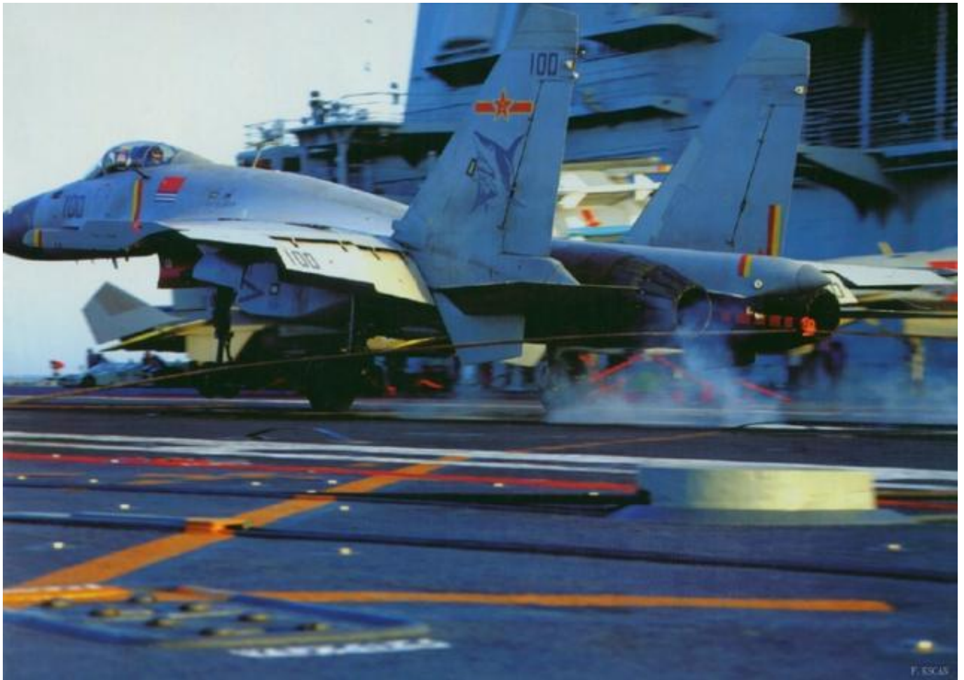
中国“辽宁”号航母的阻拦索系统是国内自行研制