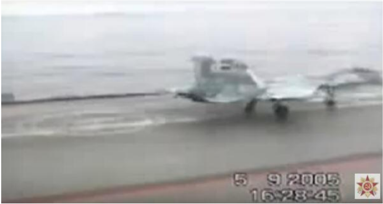
俄罗斯唯一的航母“库兹涅佐夫”号的阻拦索似乎并未彻底解决长期存在的技术问题