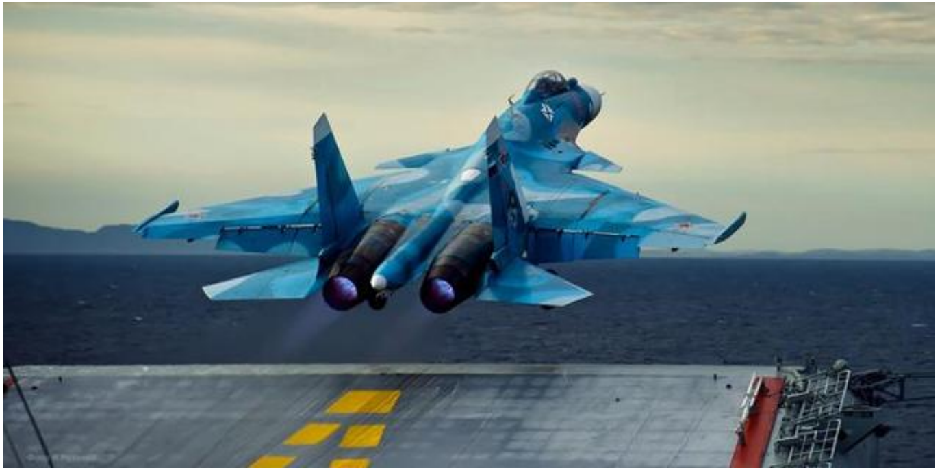
俄罗斯国防部公布的苏-33舰载机从“库兹涅佐夫”号航母上起飞的画面

12月5日，美国《航空家》网站报道称，美国国防部消息源透露，俄罗斯海军一架苏-33舰载机在12月3日试图在“库兹涅佐夫”号航母上降落时坠入地中海。