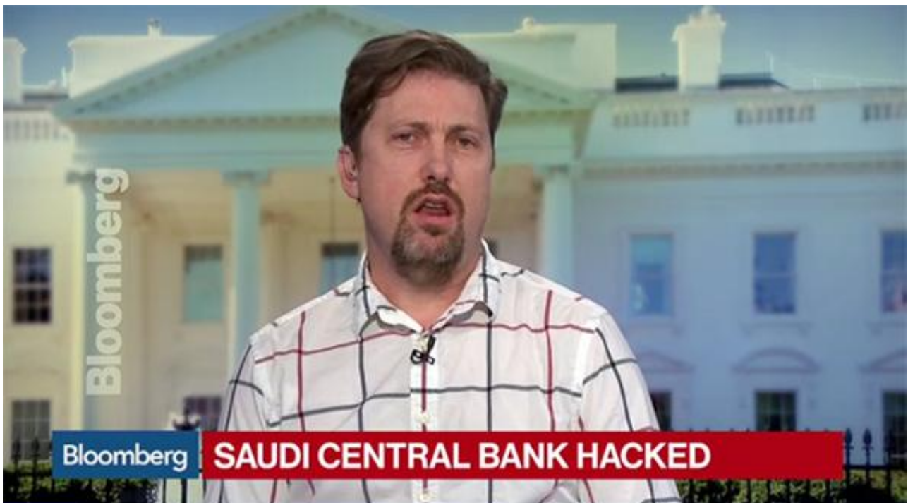
Saudi Central Bank Said Struck by Iran Malware