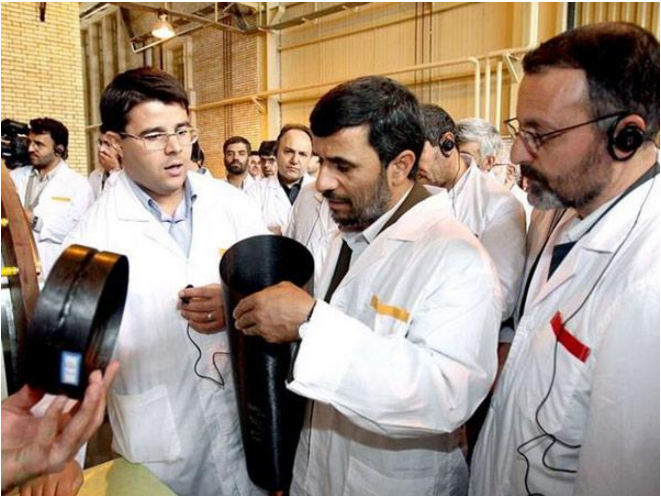
2010年伊朗核设施遭“震网”病毒攻击

2012年6月美国《纽约时报》高调披露，“震网”病毒起源于2006年前后由美国前总统小布什启动的“奥运会计划”。2008年，奥巴马上任后下令加速该计划。