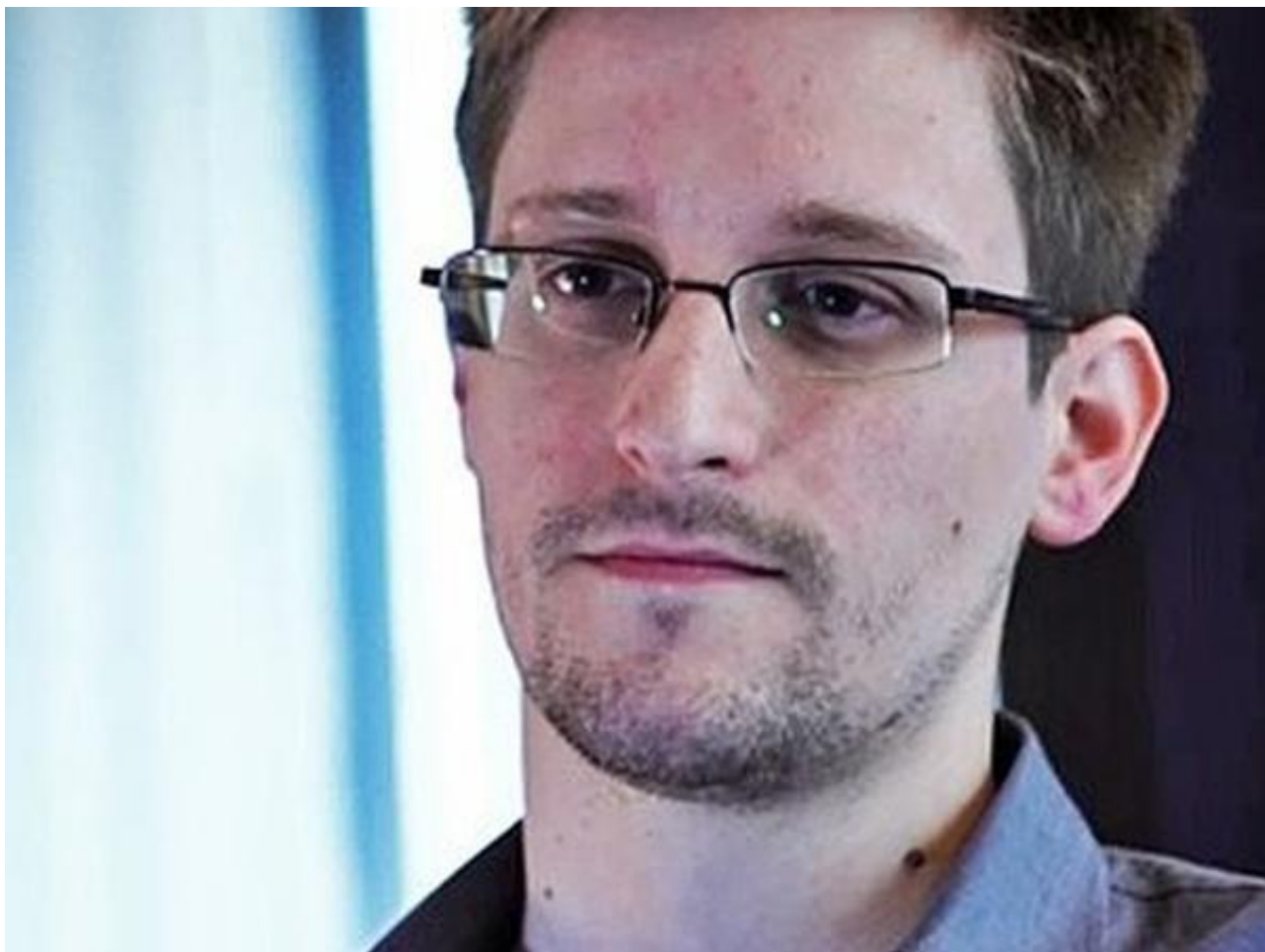
斯诺登曾多次透露美国的网络攻击计划

【观察者网综合】近日，继日本自卫队网络遭受黑客攻击后，俄罗斯和沙特阿拉伯的金融机构也遭到了网络攻击。俄罗斯央行官员2日称，该行代理账户遭黑客袭击，被盗取了20亿俄罗斯卢布(约合3100万美元)资金。而彭博社1日报道，沙特阿拉伯遭到“可能”有伊朗政府背景的黑客的袭击，多个不同网络部位的“网络炸弹”被同时引爆，造成数据丢失、国家机场管理系统瘫痪等后果。